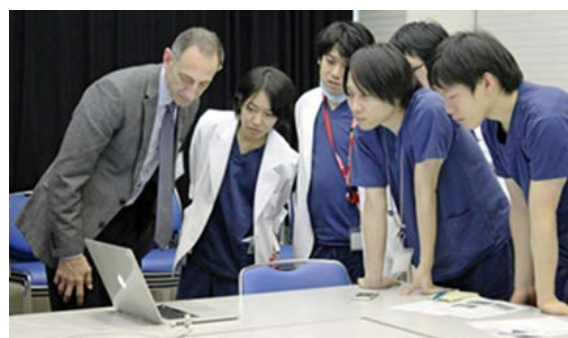
米国救急専門医によるER指導