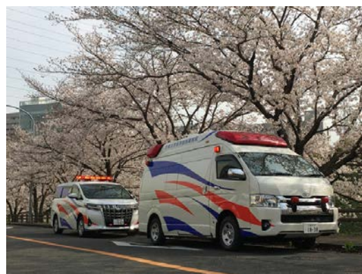
ドクターカー・DMATカー

ーが多数在籍しております。これらの off-the-job training への参加費用等も積極的に支援いたします。また、希望者に対しては米国救急施設 (ED・ER) への短期留学研修 (2 週間程度) も可能です (旅費支援あり)。さらに、大阪府救急医養成キャリアプランを利用した国内外の研修にも参加することが可能です。